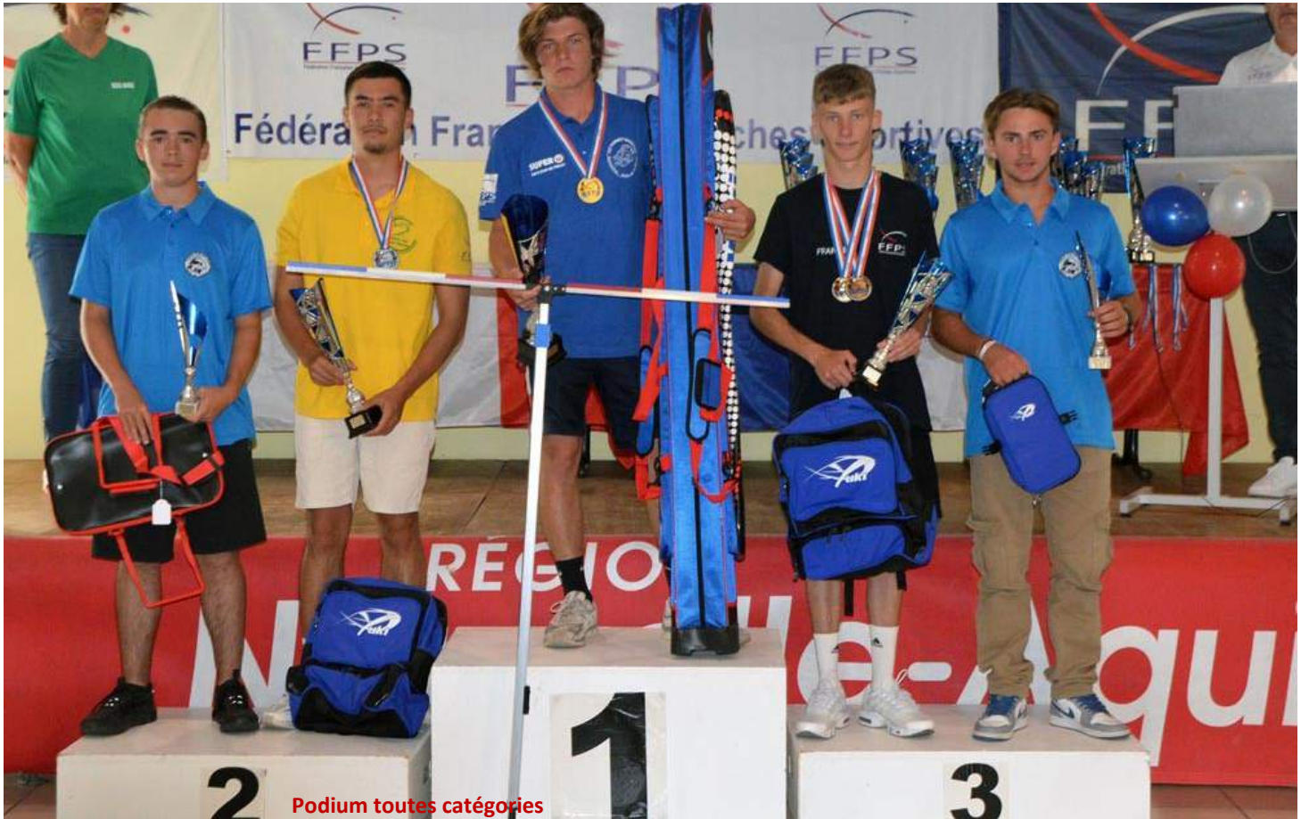
Podium toutes catégories

Le Surf Casting Club de Bias s'est vu confier l'organisation du 32ème Championnat de France Jeunes de Pêche en Bord de Mer et de Lancer de Poids de Mer par la Fédération Française des Pêches Sportives. Cette manifestation a regroupé 89 compétiteurs âgés de 6 à 18 ans venant de Bretagne, de Corse, des Pays de la Loire, des Hauts-de-France et bien évidemment de la Nouvelle-Aquitaine. Rappelons ici qu'il s'agit du plus grand rassemblement national de jeunes pour l'ensemble de notre fédération toutes disciplines et commissions confondues.