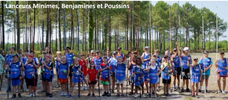
Lanceurs Minimes, Benjamins et Poussins